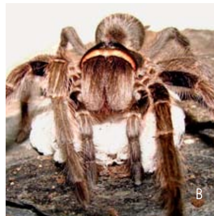
Figura 15, arriba. Hembras de la especie Grammostola doeringi . A. Construcción del saco de huevos. B. Traslado del saco de huevos finalizado entre las patas.