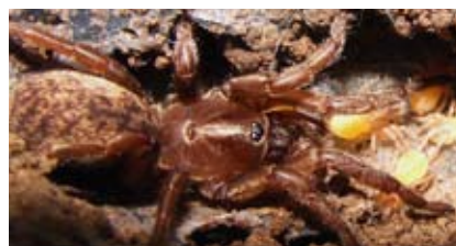
Figura 16, derecha. Hembra de la especie Acanthogonatus centralis con crías recién eclosionadas del saco de huevos.