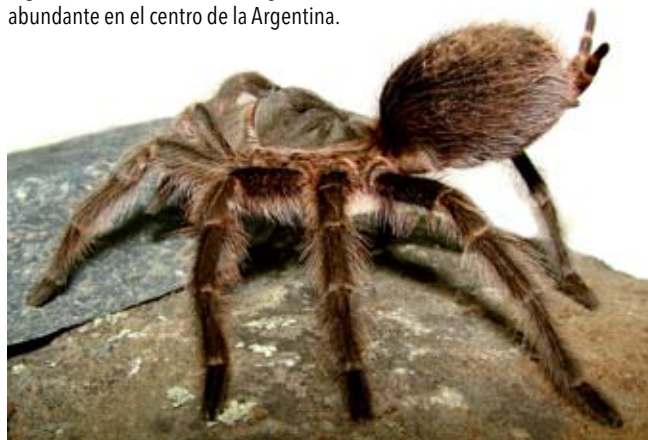
Figura 2. Grammostola doeringi , una tarántula abundante en el centro de la Argentina.

Una de las características anatómicas de las arañas migalomorfas es la posición paralela de los mencionados quelí-