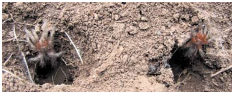
Figura 5, abajo. Hembra de Mecicobothrium thorelli fotografiada en Sierra de la Ventana, en el sur de la provincia de Buenos Aires.