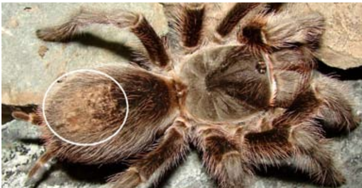
Figura 7, arriba izquierda. Araña de la familia Dipluridae ( Linothele sp.) sobre su manto de seda.