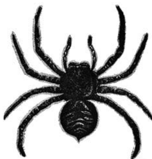
Figura 3, arriba. Lycosa tarantula . SG Goodrich, Animal Kingdom , Derby & Jackson, Nueva York, 1859.