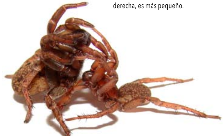
Figura 14. Cópula de dos arañas de la especie Xenonemesia platensis en la isla Martín García. El macho, a la derecha, es más pequeño.

15a) y los envuelven para formar un saco de huevos , ovisaco u ooteca (figura 15b). El número de huevos de las arañas varía enormemente, entre alrededor de diez y cerca de mil. Las crías emergen del saco sin ayuda de la madre y pueden realizar uno o dos cambios de piel antes de eclosionar (figura 16). Salen por pequeñas aberturas del saco y usualmente no reciben cuidado materno, aunque se han registrado casos de crías de arañas Theraphosidae que permanecieron cerca de la cueva de la hembra y realizaron varias mudas antes de dispersarse. Por su tamaño y cantidad, las crías constituyen parte importante de la dieta de lagartijas, sapos, aves e insectos. Sus enemigos disminuyen considerablemente cuando llegan a adultas.