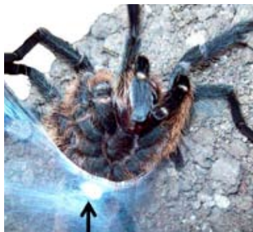
Figuras 11 a y b, arriba y abajo izquierda. Machos de Plesiofelma longisternale , de la familia Theraphosidae , caminando por el campo en Sierra de la Ventana en busca de hembras.