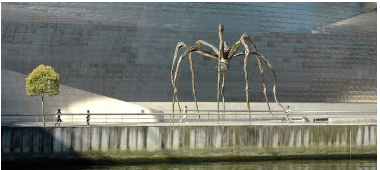
Figura 1. Louise Bourgeois, Maman , frente al Museo Guggenheim, Bilbao. La escultora escribió: ¿Por qué una araña? Porque mi mejor amiga era mi madre, y porque ella era tan inteligente, paciente, prolija y útil, razonable e indispensable como una araña. Podía defenderse por sí misma. Foto Hana Myšáková, Wikimedia Commons, 2008.

El segundo de esos subórdenes incluye dos grandes infraórdenes: Araneomorphae o arañas araneomorfas, y el que tratamos en esta nota, Mygalomorphae o arañas migalomorfas. Este es menos numeroso: en todo el mundo incluye 15 familias, que engloban a unos 300 géneros y cerca de 2700 especies. Por contraste, las araneomorfas, llamadas generalmente arañas verdaderas, comprenden más de 90 familias, cerca de 3500 géneros y casi 39.000 especies, es decir, el 90% de las especies de arañas conocidas. Son más chicas y más móviles que las migalomorfas, y exhiben mayor variedad de formas de predación.