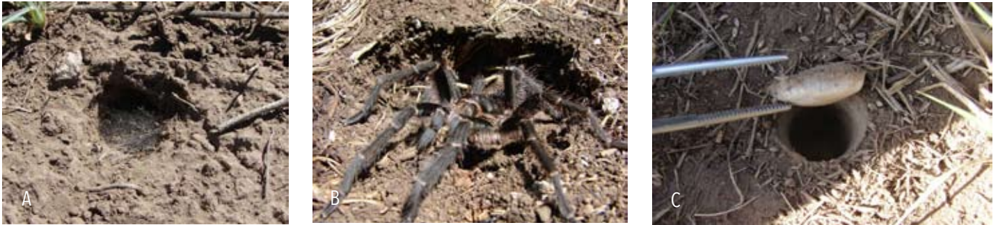
Figura 6. Cuevas utilizadas por arañas migalomorfas. A. Cueva tubular de Grammostola doeringi en Bahía Blanca. B. Cavidad debajo de una piedra ocupada por un macho de Grammostola vachoni en Sierra de la Ventana. C. Cueva con tapa y bisagra de tela de araña hecha por un individuo del género Actinopus en Sierra de la Ventana.