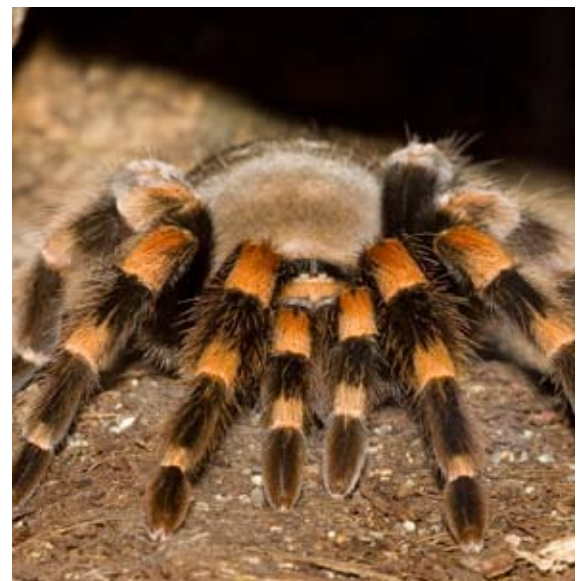
Figura 17. Brachypelma smithi o tarántula de rodillas rojas. Foto Olaf Leillinger, Wikimedia Commons, 2006.